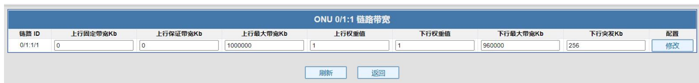
图 7.1-1: ONU 链路带宽配置

ONU 链路带宽可为每个 ONU 配置上下行带宽。通过配置最大上下行带宽，从而达到对 ONU 进行带宽限速的目的。选择 PON 口，即可对该 PON 口下的 ONU 进行链路带宽配置。