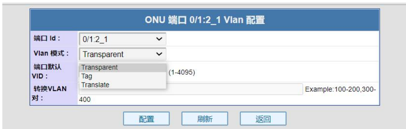
图 6.1-1: ONU 端口 Vlan 划分