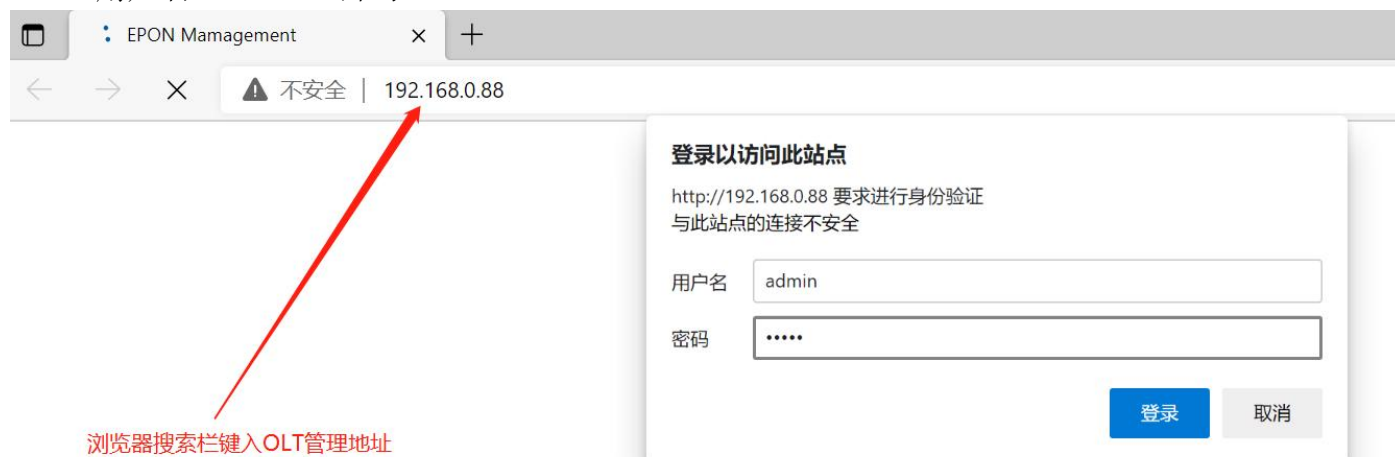
图 1.2-2：浏览器登录 web 图示

内管理： 将本地电脑的 IP 改为 192.168.1.X，掩码：255.255.255.0。其他步骤和外管理一致，访问内管理 IP 为 192.168.1.88。