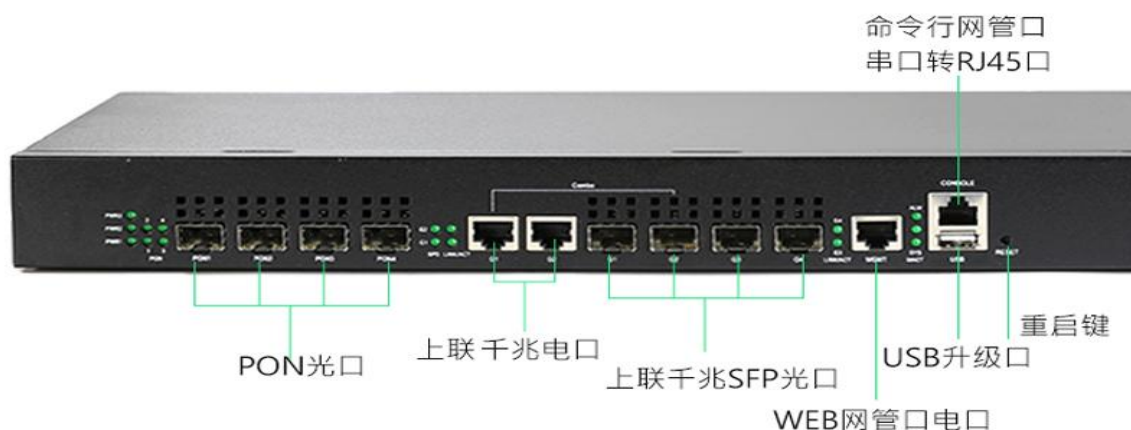
图 1.1-1: OLT OP3904C

OP3904C 提供 4 个 EPON 口，2 个千兆光口，2 个千兆 Combo 口（即 1000M SFP 光口和 1000M 自适应 RJ45 电口互换）一个 console CLI 串口，一个 USB CLI 串口，一个 MGMT 管理口，一个 RESET 重置孔。