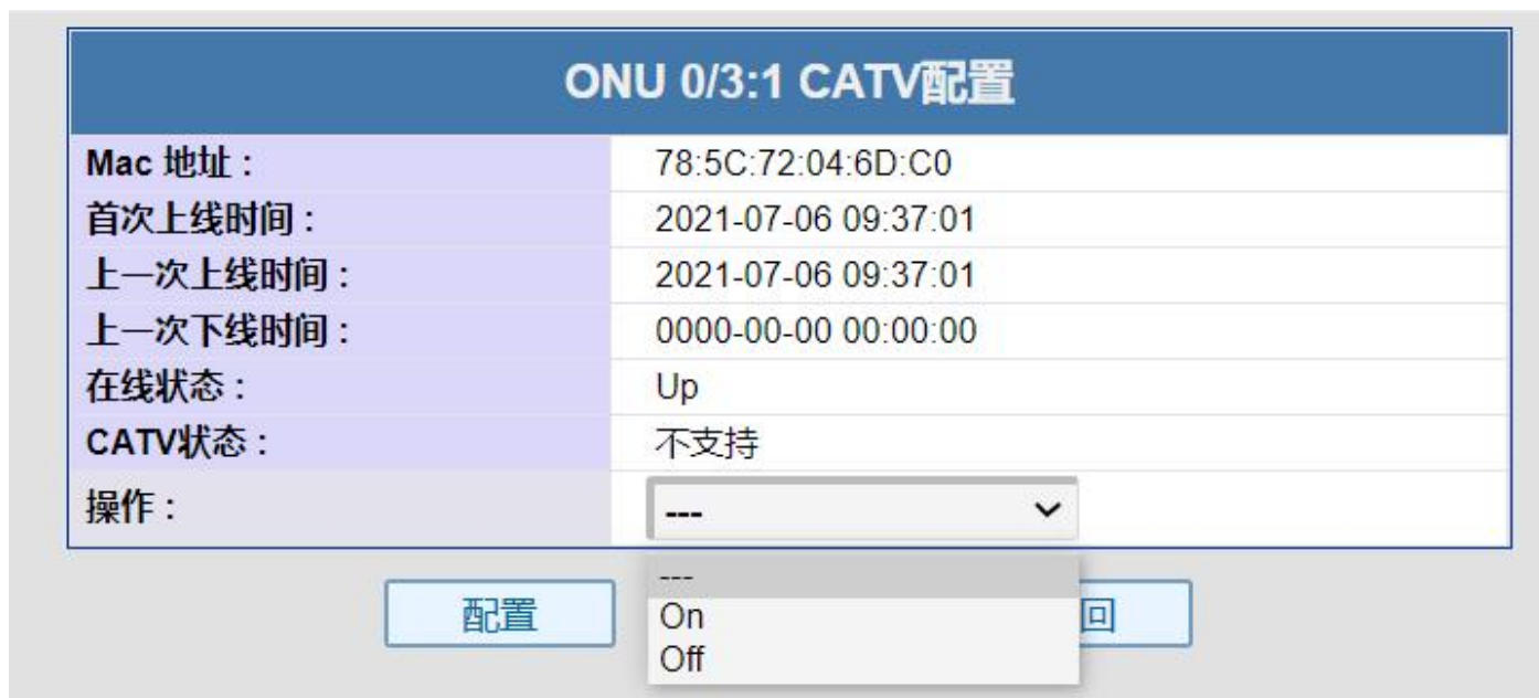
图 3.6-1: ONU CATV 配置

CATV 配置可对 ONU 的 CATV 功能进行管理（需 ONU 支持）目前仅支持本公司 ONU 设备。选择相应的 PON 口，即可对该 PON 口下的 ONU 进行 CATV 配置。