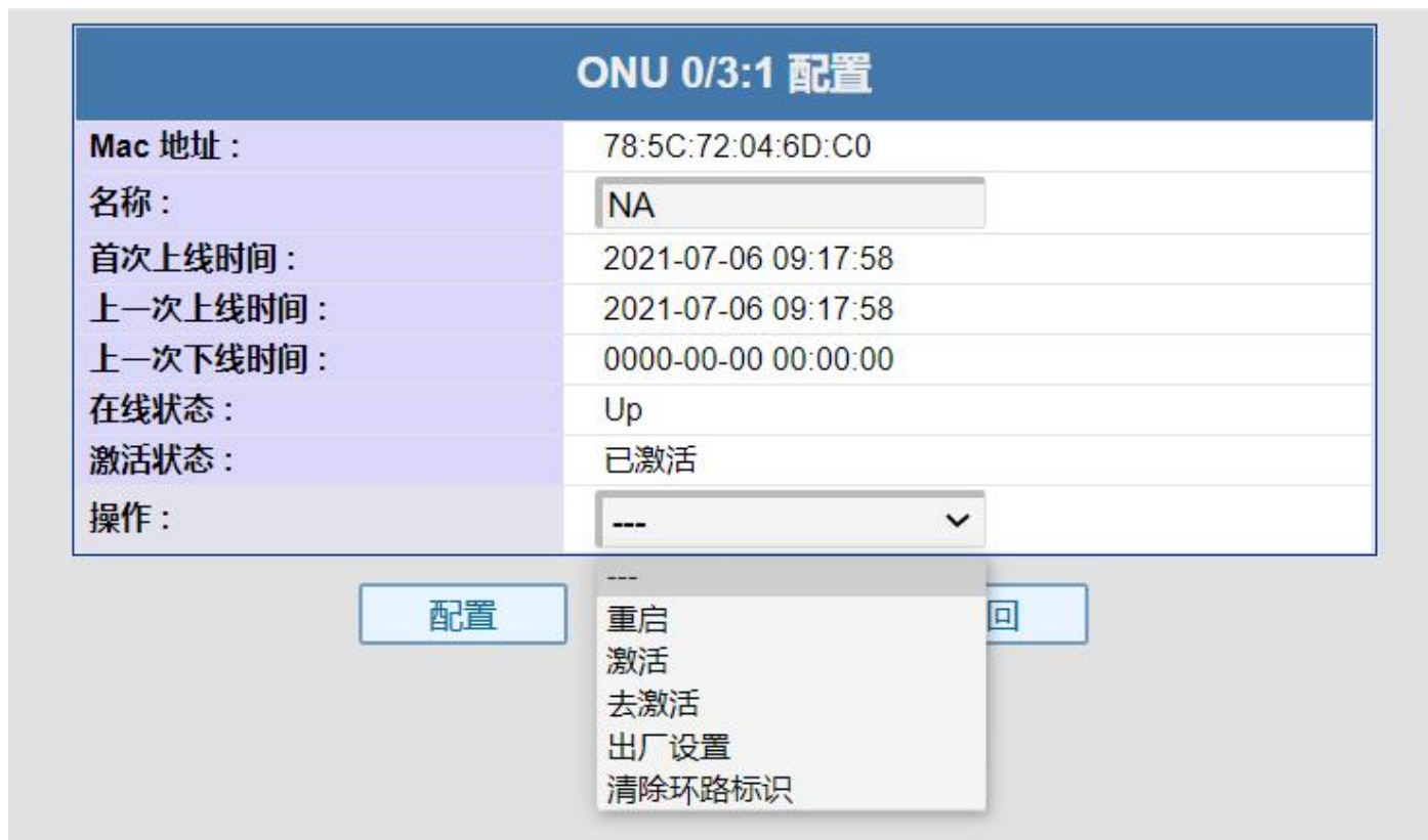
图 3.1-2: PON 口下的 ONU 管理设置